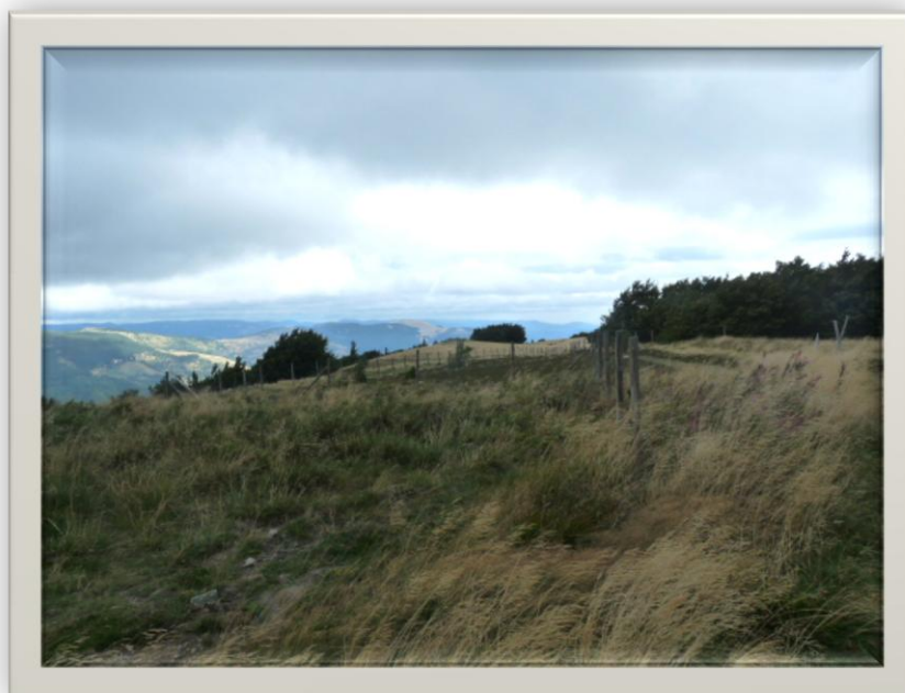
Le Grand Ballon 1 400 m

Depuis Thann, nous décidons de faire le Grand ballon .