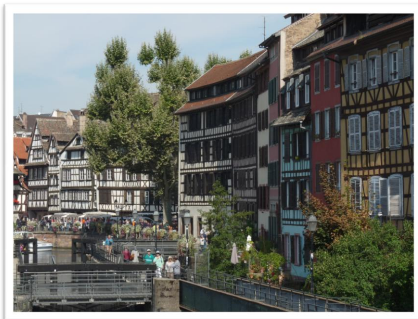
La petite France

Bien sûr à ne pas oublier la petite France , surtout le matin pas trop tard, au moment où les commerces se préparent, c'est vraiment sympa.